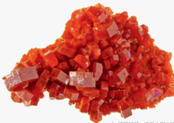
＞ 红钒铅矿

我国钒矿主要有两种类型，一是与岩浆活动相关的岩浆型钒矿，主要有河北承德大庙黑山钒钛磁铁矿和四川攀枝花钒钛