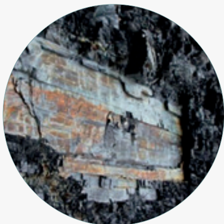
＞ 湖南省西部黑色岩系