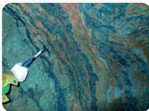
＞ 沉积型钒矿：南秦岭千家坪钒矿矿体特征（徐林刚等，2022）