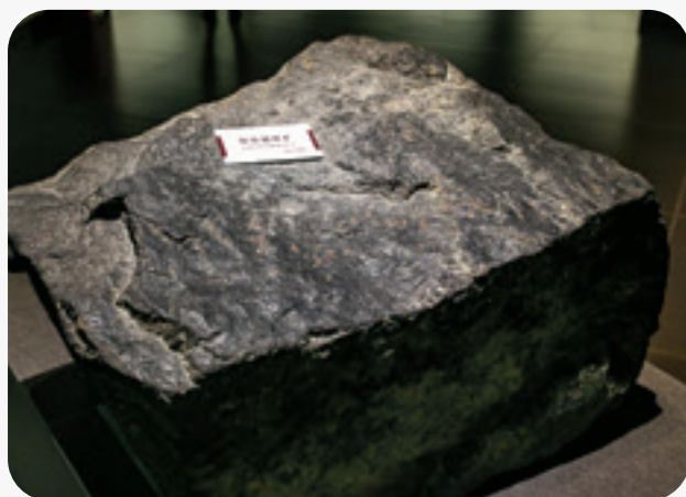
＞ 岩浆型钒矿：钒钛磁铁矿

黑色岩系在贫氧或缺氧水体中形成，是具有一定沉积学、古生态学和地球化学特征黑色细粒沉积岩组合。它形成于地球演化中特定的地质环境，具有多类型和成因多样化特点，不同黑色岩系反映出不同地质背景和沉积缺氧环境。普遍具有陆源碎屑、深部热流、生物和宇宙等多种物质来源，主要包括硅质岩、磷块岩、碳质泥岩、粉砂岩、