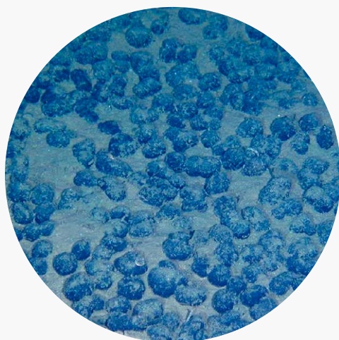
> “蛟龙”号载人潜水器在南海“蛟龙海山”发现锰结核